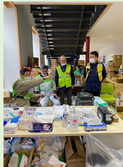
輪島中学校体育館 入口