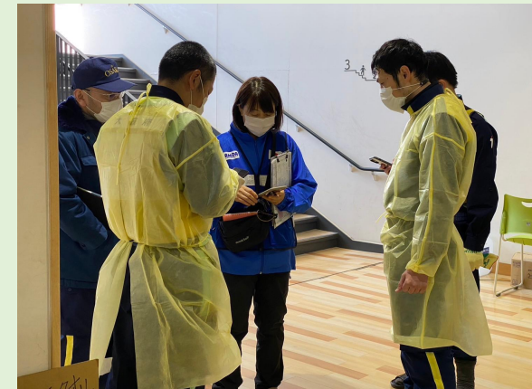
校舎内(病室管理業務打合せ)