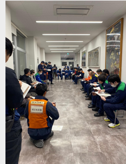
輪島市 対口支援リエゾン会議