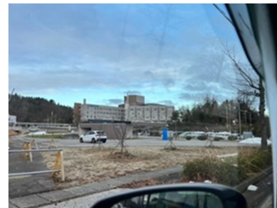
能登医療圏DPAT活動拠点本部