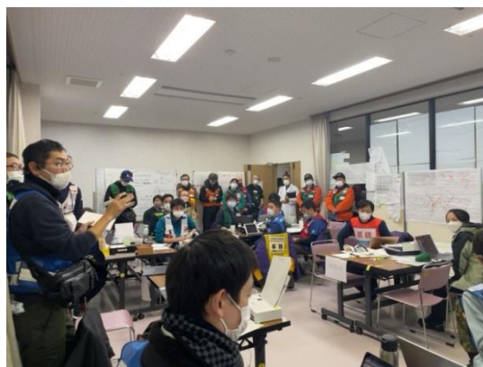
穴水保健医療調整本部会議