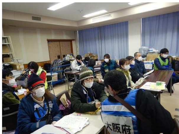
保健師ミーティング (能登北部保健所)