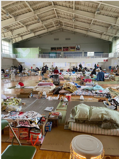
河井小学校体育館