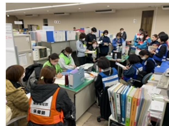
穴水町・他府県応援保健師との会議