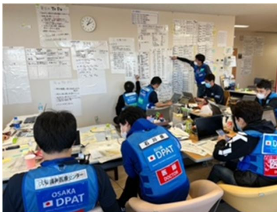
能登医療圏DPAT活動拠点本部