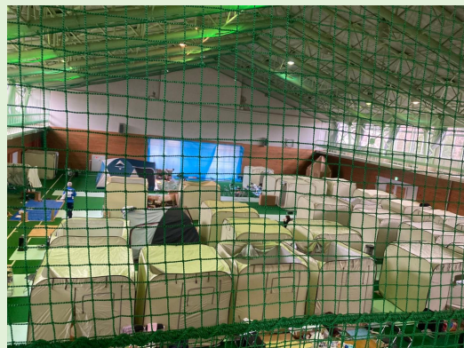
輪島中学校体育館