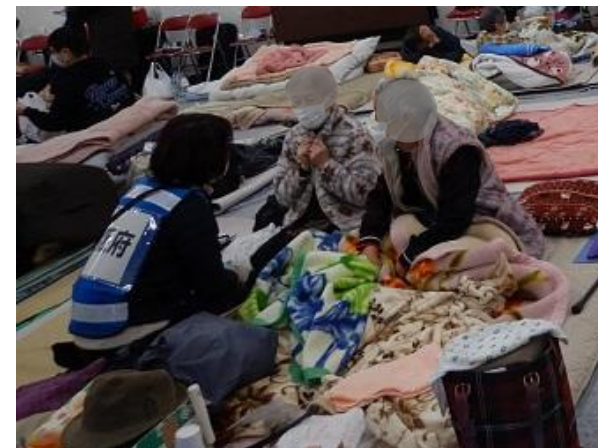
避難所での健康支援